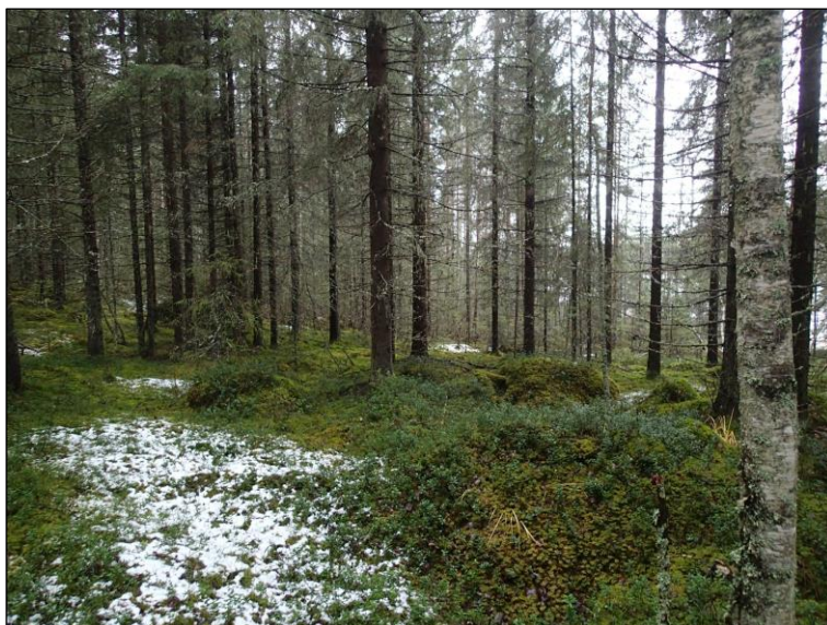
Kiinteistön pohjoisosan rannan tuntumassa maastossa erottuu Muinais-Saimaan korkeimman rannan törmä osin pallekivikkona (vasemmalla)