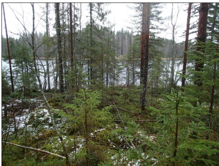
Kiinteistön kaakkoisosan rantaa (yllä ja alla)